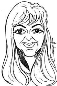
María del Mar Bonet

Después de veintidós discos, tiene a la fuerza un repertorio largo y, para la otra noche, se reservaba piezas como aquella del turco Zulfú Omar Livanelli, con la que, inyectando vitalidad, quiso comenzar el recital, aunque, obviamente, uno supiera que la cosa jamás terminaría en esa fiesta que, con el nombre de Merhaba, hace año y medio, dio en ser su