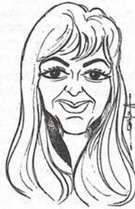
María del Mar Bonet

En «Salmaia» (mezcla de agua dulce y agua salada), un magnífico y profundo trabajo se encuentran canciones de Ibiza, Grecia, Nápoles, y Sicilia junto a piezas del cantautor turco Zülfü Omar Livaneli y el acompañamiento del Ensemble de Música Tradicional de Túnez o el guitarrista Toti Soler. Cantantes, artistas, intelectuales, soñadores, luchan y trabajan día tras día por ofrecer una imagen del Mediterráneo construida con algo más que integrismo o xenofobia, dos extre-