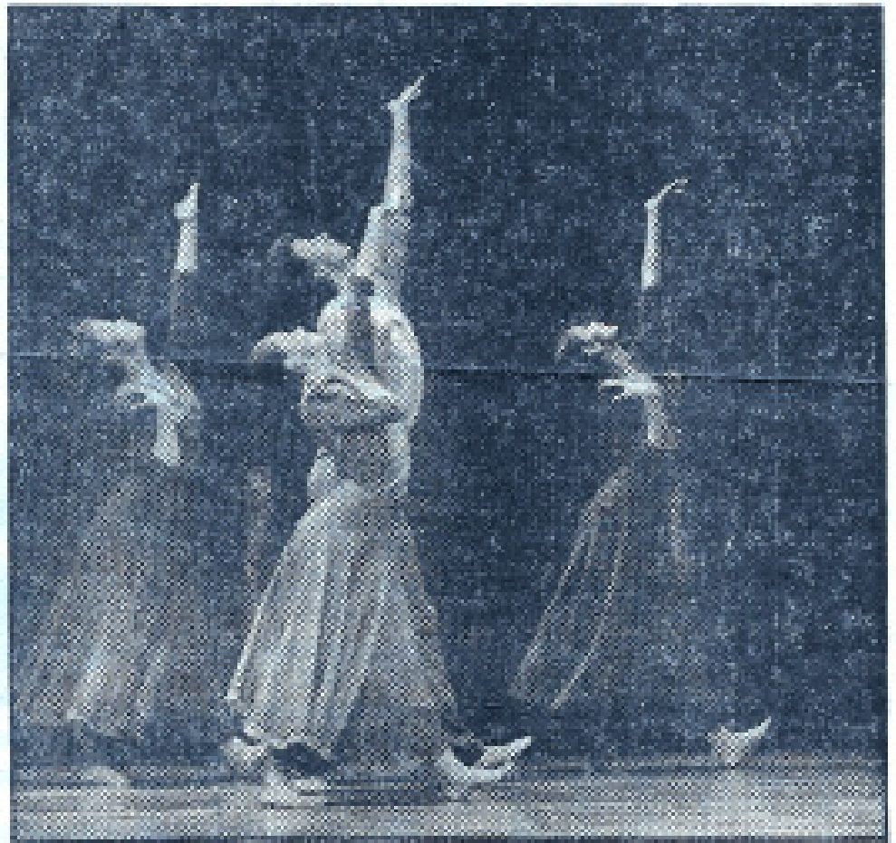
"Jardí tancat" una coreografía sobre la tierra y el trabajo