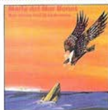
Bon viatge faci la cadenera (1990)