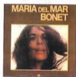
Maria del Mar Bonet (1983)

-Crec que parlar d'això es presta fàcilment als malentesos. Qualsevol cosa que digui es pot prestar a comentaris com: "Aquesta dona ara no viu aquí i critica necessitats." Jo crec que la gent que es ven la terra és per necessitat, ja sigui a alemanys o a francesos. Que dins d'aquestes necessitats n'hi ha unes de prioritàries i d'altres que no ho són tant és segur. Pens que, més que criticar, el que s'hauria de fer des de les més altes instàncies, com pot ser el Parlament Europeu, és intentar preservar l'illa, que no es destrossés més. Quan es parla de grans extensions és una cosa, però quan es tracta d'una illa petita, on la terra és limitada, calen unes lleis reguladores del territori. Però tot això pot semblar molt frívol, com d'una persona que s'ho mira de fora i critica, i no és així. Pens que cadascú sap les necessitats que té; si s'han venut la casa, tenen unes raons. Un no pot dir que