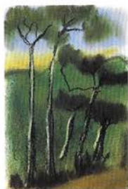
Sense títol (1995) Pastel damunt paper