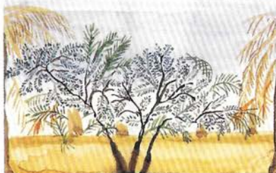
Sense títol. Aquarel·la damunt paper