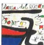
Maria del Mar Bonet (1974)