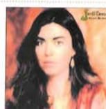
Jardí tancat (1981)