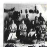
Saba de terror (1979)