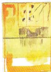
Sense títol (1990) Aquarel·la i llapis