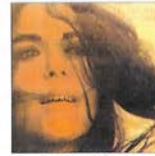
Anells d'aigua (1985)