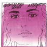
Maria del Mar Bonet a l'Olympia (1975)