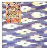
Cançons de festa (1976)