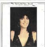
Gavines i dragons (1987)

■ Aquestes són les principals portades dels discos de Maria del Mar Bonet. De vegades, s'han fet reedicions d'un mateix elapè, que no s'han recollit en aquesta selecció. També hi manquen els dos primers discos de la cantant mallorquina. Concretament, Maria del Mar Bonet (1969), editat per Concèntric, i Maria del Mar Bonet (1974), per Boccaccio Records.