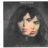
Maria del Mar Bonet (1974)