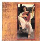
Breviari d'amor (1982)