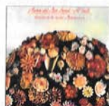
Cançons de la nostra Mediterrània (1980)