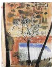
Sense títol (1993) Aquarel·la sobre paper