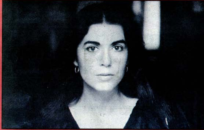
►► Imatge del programa de mà del concert de Bonet a la plaça del Rei el 1983.